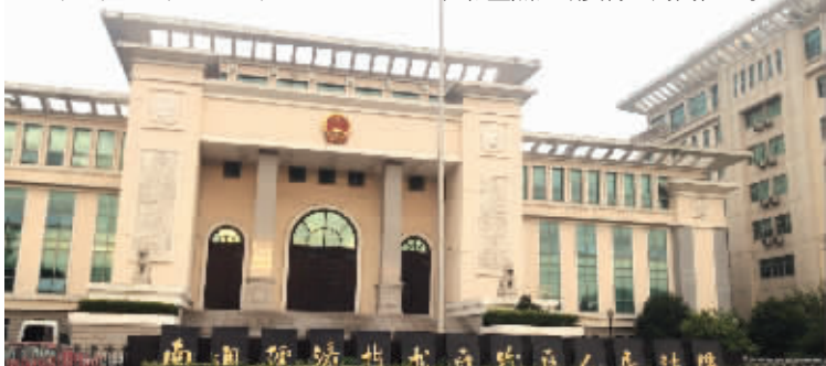
法院大门

这次南通警方启动了关城门预案抓捕逃犯。那什么是“关城门”抓捕逃犯呢?现代快报记者从公安部门了解到,“关城门”如今其实是警方围堵犯罪嫌疑人的一种策略。警方启动“关城门预案”后,会启动所有治安卡口、查报站、岗亭开展盘查,并在城郊接合部等关键部位设置流动卡点,同时对一些重点部位和重点区域实行全封闭检查。