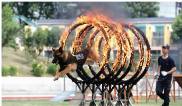
缉毒犬实战演练,跳跃火圈障碍

6月26日上午,南通开发区法院在审理一起贩卖毒品案件时,一名贩毒嫌疑人跳楼逃脱,随即警方启动关城门预案抓捕。事发后,当地法院通报称,当时嫌疑人提出要上厕所,未经法官准许突然冲出法庭,并迅速从二楼跳窗逃跑。目前当地市、区两级公安机关正在全力缉捕犯罪嫌疑人。截至记者发稿前,缉捕工作还在进行中。