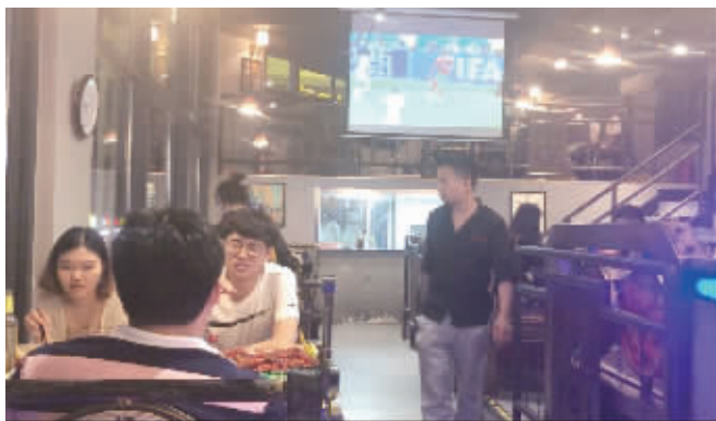
龙虾店生意并未因世界杯更火爆