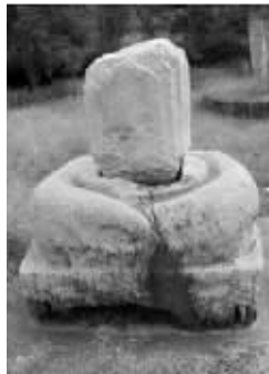
受方案影响的南朝石刻