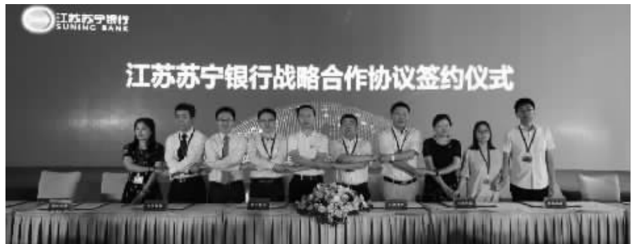
苏宁银行与鱼跃医疗等9家企业举行战略签约仪式

6月15日，江苏首家民营银行首次对外发布成绩单。据悉，开业满一周年，苏宁银行资产规模已经突破220亿元，贷款和存款余额分别超100亿元、180亿元，其中供应链金融贷款投放超过50亿元；获得工商银行、建设银行、招商银行、中信银行等50家银行的同业授信，授信规模达到490亿元；个人客户数已达数百万，企业客户数超千户。 据苏宁银行方面透露，苏宁银行目前已经实现首批对公贷款业务落地、首笔国内信用证及福费廷业务和首笔同业存款业务落地；发行了自主品牌借记卡，并将区块链技术用于国内信用证业务，成为继中信银行、民生银行后加入国内信用证区块链联盟的全国第三家银行；企业网银、线上电子账户平台、微信银行、区块链黑名单共享平台系统、供应链金融系统和电票系统也纷纷上线。 发布成绩单的同时，苏宁银行还正式发布了市民贷和税e贷两款新产品。据介绍，市民贷