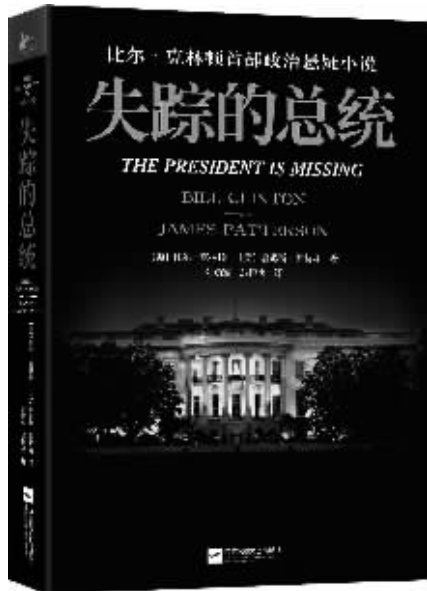
《失踪的总统》 [美]比尔·克林顿 [美]詹姆斯·帕特森 著 凤凰联动/江苏凤凰文艺出版社 2018年5月