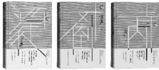
《刘以鬯经典》(共3册) 刘以鬯 人民文学出版社 2018年6月

6月9日,香港著名作家刘以鬯逝世,享年一百岁。这位香港文学耆宿的离世,不仅是香港文学的巨大损失,也为其参与的百年新文学史上画上一个沉重的句号。