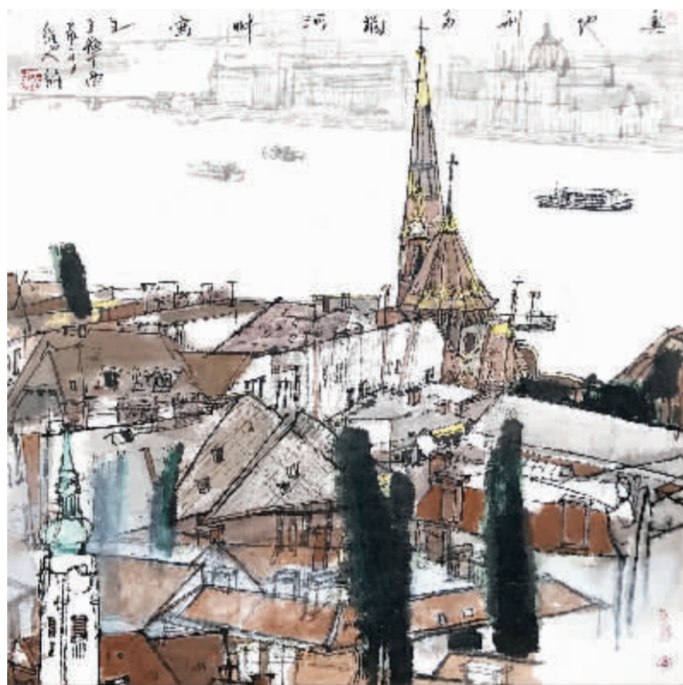
《布达佩斯多瑙河畔》