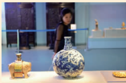
观众在观看“博物馆的历史”专题展上展出的珍贵展品