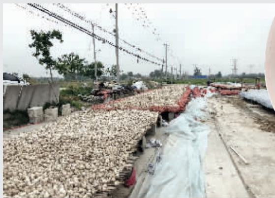
大蒜丰收，价格却跌了不少