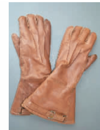
陈怀民烈士的手链和手套