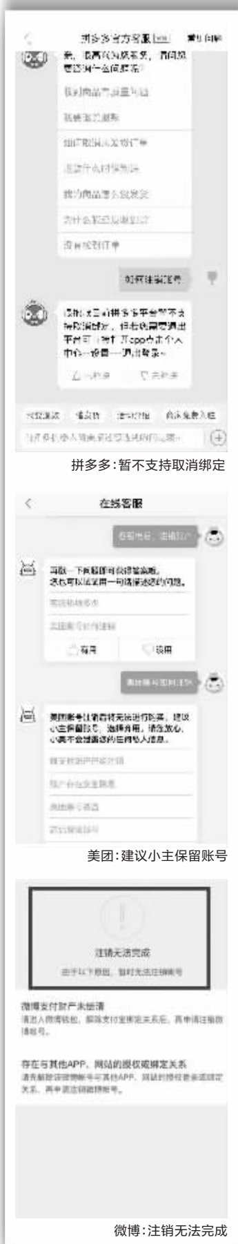
拼多多:暂不支持取消绑定

《电信和互联网用户个人信息保护规定》(工业和信息化部令第24号)第九款第四款也规定:“电信业务经营者、互联网信息服务提供者在用户终止使用电信服务或者互联网信息服务后,应当停止对用户个人信息的收集和使用,并为用户提供注销号码或账号的服务。”