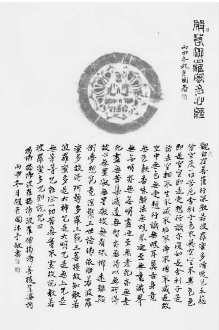
《般若波罗蜜多心经》