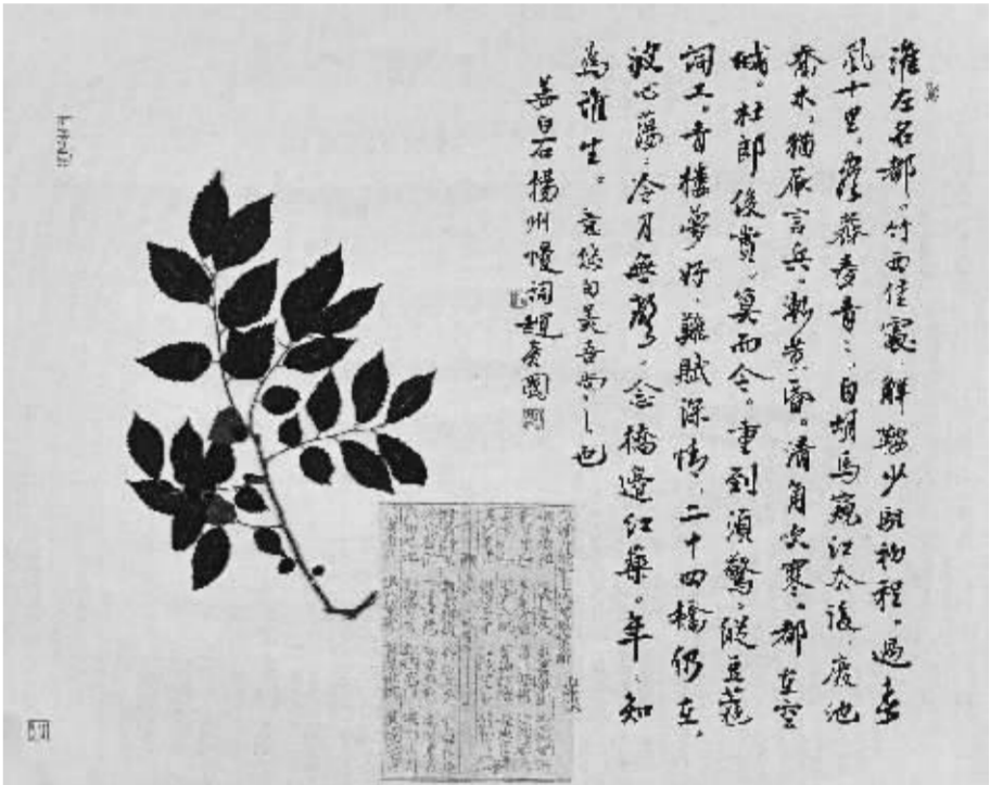
《素心及物草木状系列之八》