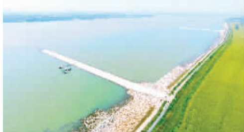
▲昨天在南京港龙潭天宇码头装载货物的海轮