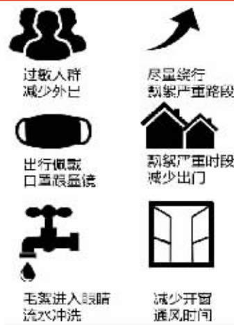
制图 俞晓翔 数据来源:@江苏气象