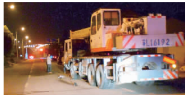
事故现场

快报讯(通讯员 赵竹生 记者 林清智)无驾驶证、违规操作,近日,镇江一名司机的一系列交通违法行为酿成悲剧,导致一名男子被撞成重伤、后经抢救无效身亡。肇事司机逃逸并找人顶包。