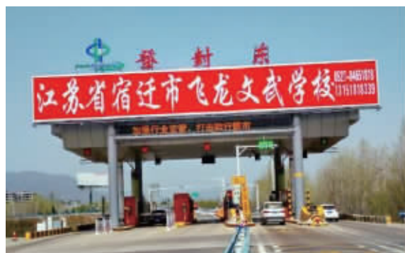
宿迁市飞龙文武学校在登封东收费站投放的广告