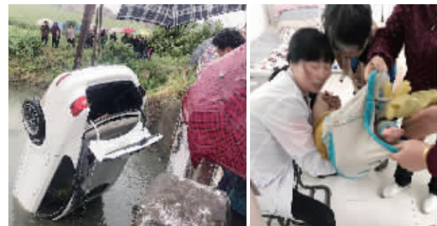
轿车翻入河中,村民紧急救人

快报讯(通讯员 刘燕 记者 姜振军)5月5日上午10点30分左右,在盐城市盐都区张庄街道境内,一辆轿车失控翻入河中,一名孕妇和5岁孩子被困。闻讯后,当地村干部、村卫生室护士和好心村民破窗将人救出。现代快报记者了解到,因救援及时,被困人员全部脱离危险。