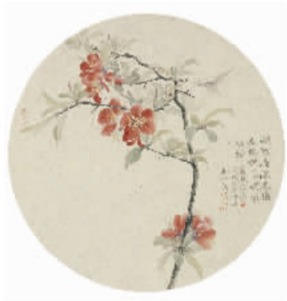
姚媛《三台山写生花卉》