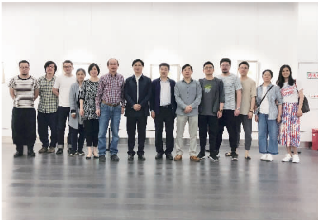
展览开幕式现场嘉宾合影