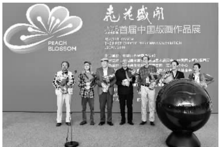
中国第二代版画家代表在开幕式现场合影