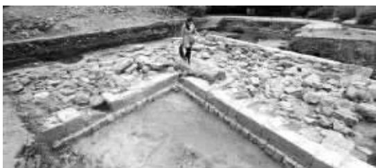
考古发现的通济门瓮城西北角城垣

作为南京明城墙十三座明代京城城门之一,中华门北广场将实施景观提升工程。启动中华门保护和展示项目,扩大中华门公共展示空间。推进中华门加固消险及中华门城楼保护工程。