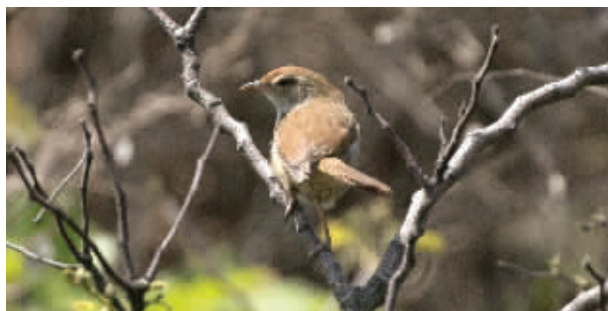
远东树莺