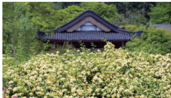
古林公园的木香花开得正好

在古生物博物馆,这里的蔷薇比别处更加娇艳,路过的市民和游客都不时停下脚步,以古色古香的鸡鸣寺山墙为背景拍美照。还有南大、东大、南艺和中山植物园等,都有大片大片的蔷薇花。