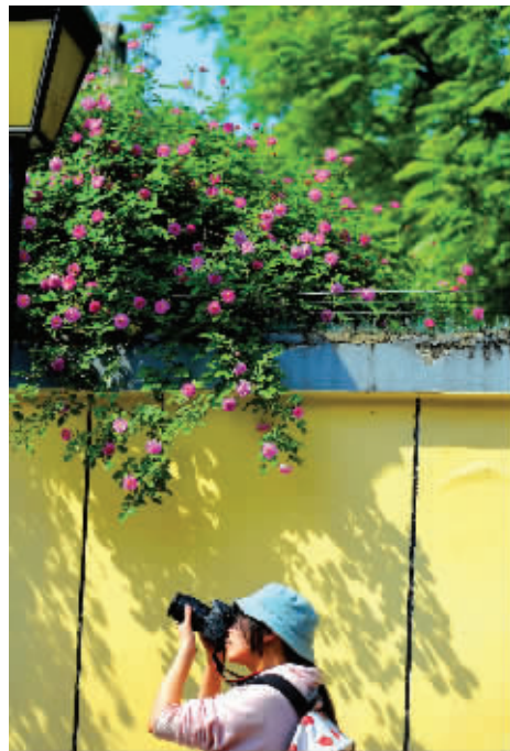
琅琊路附近的蔷薇花吸引了不少人来拍摄