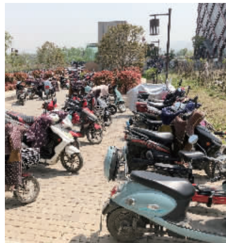
地铁4号线灵山站附近停放了不少车

快报讯(记者 吕洁)最近,“南京最荒凉地铁站”上了热搜,引发不少网友议论:这里到底有多荒凉?会不会不安全?地铁工作人员怎么解决吃饭问题?4月17日,现代快报记者来到南京地铁4号线灵山站,实地探访了这个“荒凉”的站点。