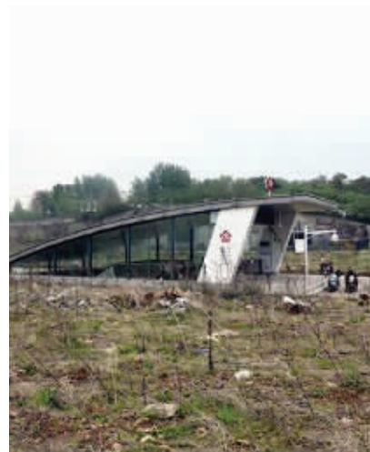
网传的南京最荒凉地铁站