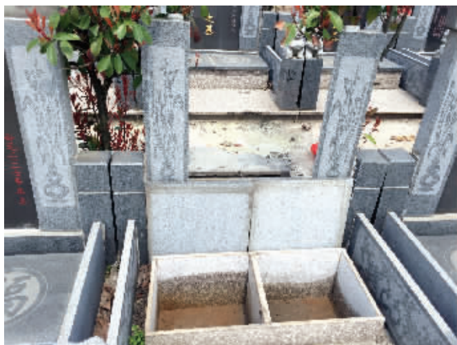
公墓的双穴墓，把中间的隔断打掉，面积就能扩大一倍了