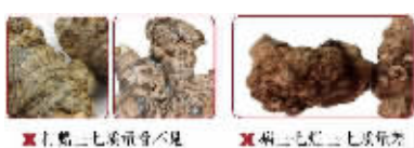
左:正常三七表面看不见白粉 右:病三七三七表面有白粉