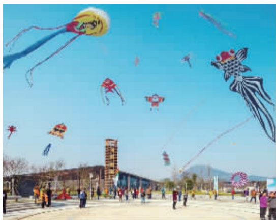
各类风筝争奇斗艳