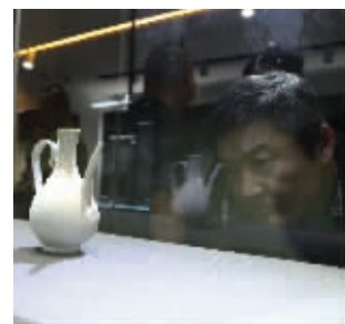
不少爱好者前来参观

“我从河北过来的,听说宋代五大窑的瓷器都聚集在一起,特意过来一饱眼福,这样的机会太难得了。”看了展览,不少收藏爱好者大呼过瘾,表示每一件展品都非常珍贵。