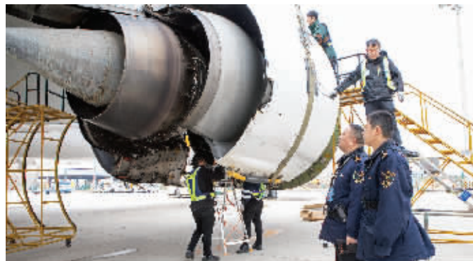
金陵海关驻禄口机场办事处关员对飞机维修进行监管

事航班由泰国酷鸟航空公司执飞。酷鸟航空公司现场工作人员告诉现代快报记者,此次飞机被雷击的位置比较特殊,恰好是机身不导电的地方,所以损伤相对严重。“飞机引擎罩后面的地方有损伤,破了一个洞,不过引擎内部完好。”维修工作,主要是将受损部分——右边发动机整流罩卸下,再将新的整流罩安装上。