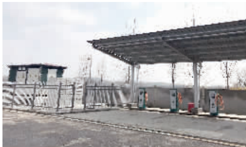
建在长深高速六合服务区的光储充一体化电站