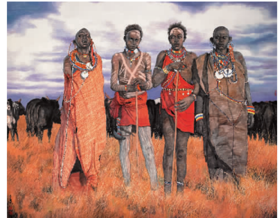
李鼎成《塞伦盖蒂(非洲坦桑尼亚大草原牧民)》