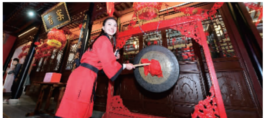
一身汉服的美女主播抽空敲了个锣

记者在进入平江府路时,发现路边有大量穿着红马甲的志愿者,他们脖子上挂着一个吊牌,牌子上有二维码,他们的肩膀上也贴着二维码。一名志愿者说:“没有预约门票的游客,可以扫我们身上和脖子上的二维码,就可以预约订票了。”