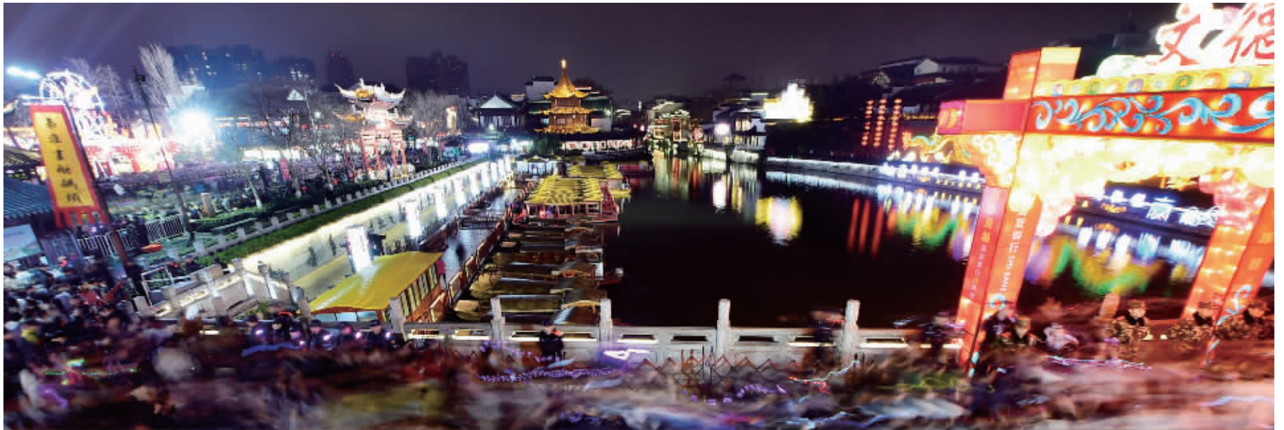
花灯如昼,游人如织,这样的夫子庙才是正宗的南京味儿