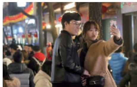
幸福一刻,怎么能少得了自拍