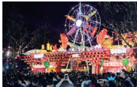
小小摩天轮很是抢镜