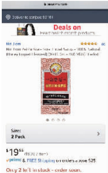
亚马逊网站上显示,目前念慈菴的售卖价格是19.56美元两瓶