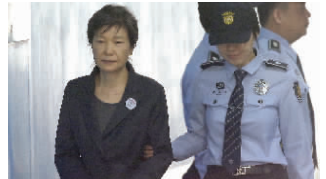
这是2017年10月10日在首尔拍摄的韩国前总统朴槿惠的资料照片