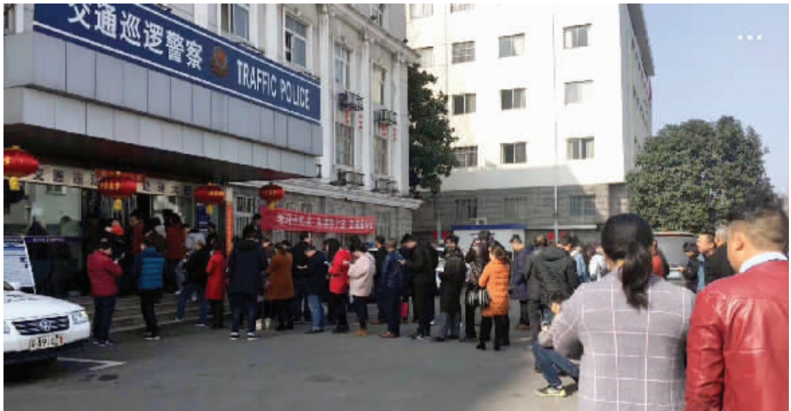
昨天,南京多个处理违章曝光的窗口排队长队