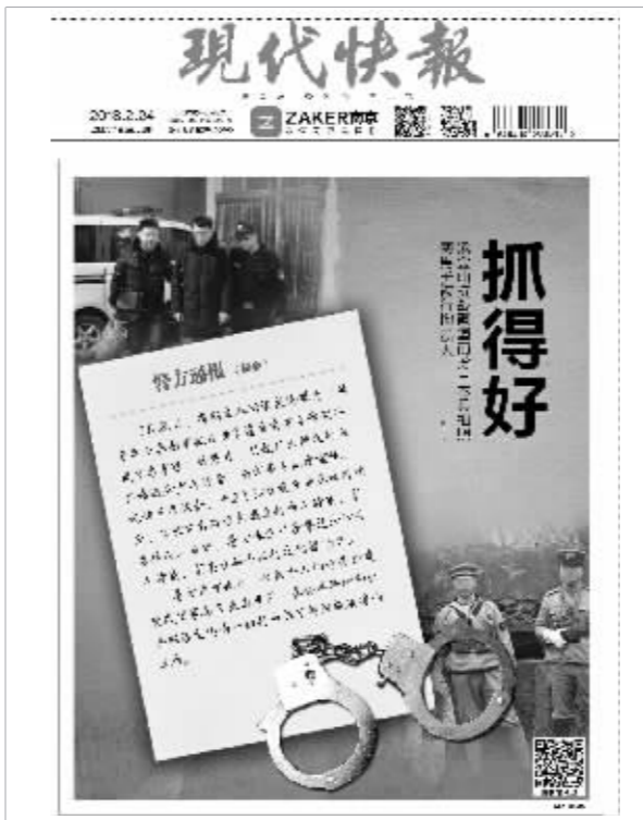
持续关注! 现代快报昨日头条