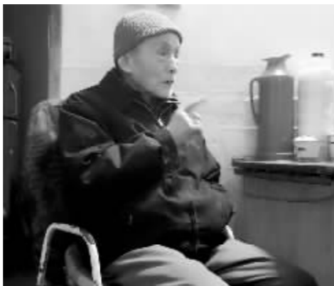
王义隆对媚日青年的行为极其愤慨