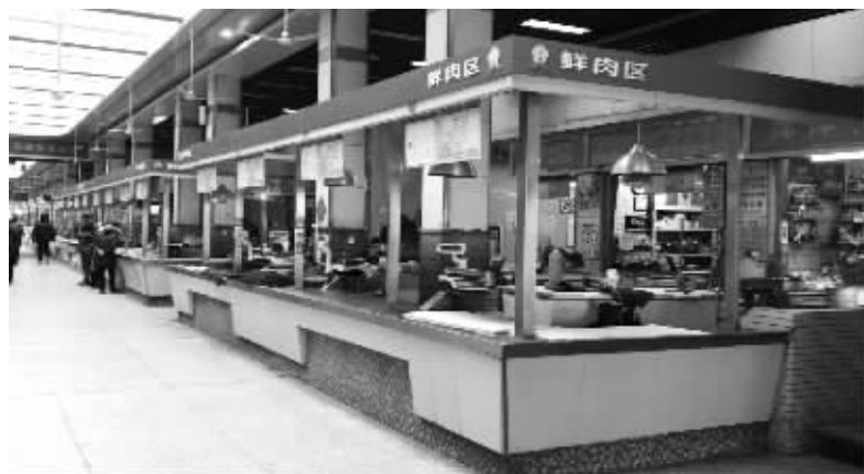
昨天,进香河菜场里的一些摊位提前收工

中饭好不容易解决了,晚上下班去哪里买菜呢?现代快报记者昨天走访发现,目前南京市部分菜场还没开业,已经开始营业的生意也比较冷清,蔬菜价格较贵。而在南京众彩节后第一天,蔬菜价格跌多涨少,往后几天蔬菜价格将变得更方便。