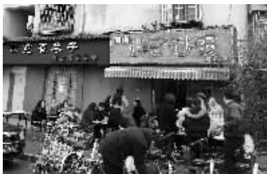
新街口附近一家开门的砂锅店前排起了队