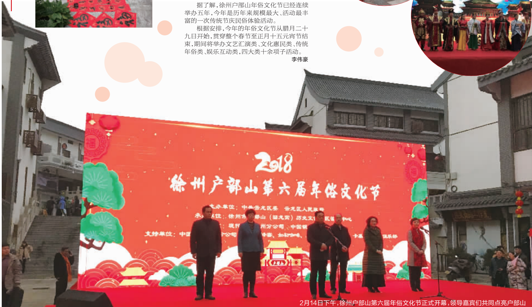
2月14日下午，徐州户部山第六届年俗文化节正式开幕，领导嘉宾们共同点亮户部山