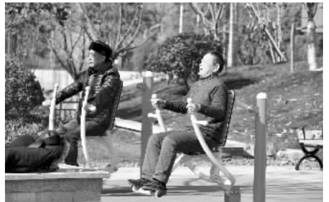
梅山文体公园满足了居民健身休闲需求

快报讯(通讯员 张浩 记者 刘峻)露水、阳光点缀着的清晨,城市刚刚苏醒,梅山文体公园内却有如日上三竿般“生龙活虎”:晨跑的青年、打太极的大爷、跳广场舞的大妈,不同的是每个人都沉浸在属于自己的一片天地,相同的是大家内心所洋溢着的幸福和快乐。自今年元月梅山文体公园建成开放以来,这样的景象早已成为一种日常。