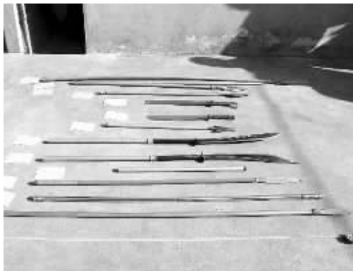
缴获的各类作案工具

快报讯(通讯员 苏官新 记者陶维洲)党中央国务院作出开展扫黑除恶专项斗争部署后,江苏成立由省省委常委、政法委书记王立科任组长,副省长、公安厅厅长刘旸,省检察院、省法院和司法厅主要领导任副组长,27个单位负责同志为成员的省扫黑除恶专项斗争领导小组。全省公安机关闻令而动,部署开展“冬季攻势”,组织力量深入易于滋生黑恶势力的重点地区、重点场所,全面摸排涉黑