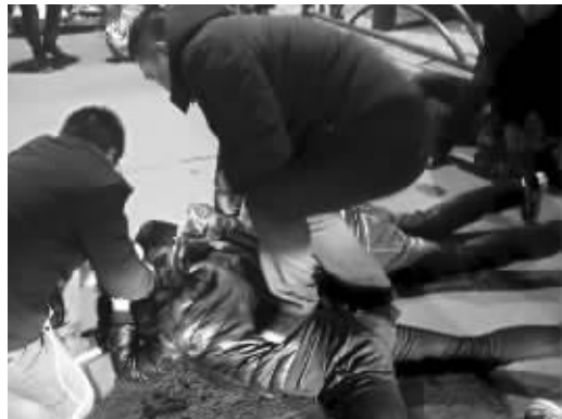
警方抓捕涉黑涉恶分子