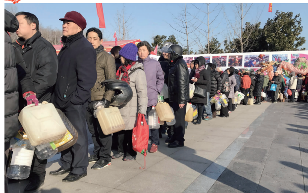
打酱油的队伍排成长龙

2月3日上午,江苏镇江市再现集体打酱油的盛景。打酱油的地点位于镇江市南南北广场,3日上午8点多,现代快报记者来到现场时,这里已经排起了长龙,等待打酱油的队伍拐了几个弯,约有百米长,排队的男女老少拿着各种壶、桶。 和往年一样,今年打酱油的流程仍然是先花钱买票,再到临时搭建的篷房内凭票打酱油。在篷房里,11口装着散装酱油的大缸一字排开,每个缸里都有1000斤酱油,11名师傅正拿着木勺,不断地从缸里舀酱油,再通过漏斗倒进市民带来的各种容器里。