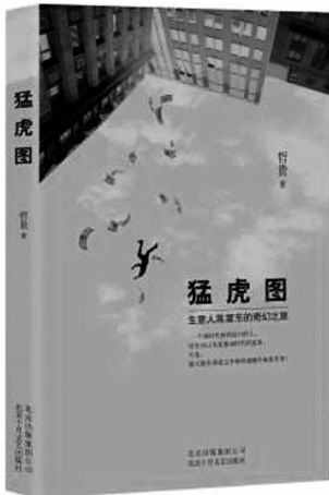
《猛虎图》 哲贵 北京十月文艺出版社 2017年1月

腰缠万贯的大老板陈震东一下子破产了,他的亲人,他的朋友,他的下属,都变成一只只“吊睛白额猛虎”