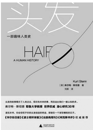
《头发:一部趣味人类史》 [美]库尔特·斯坦恩 广西师范大学出版社 2018年1月

“微历史”渐兴,紧扣小物件、小事件,切入历史的侧面,让那些似乎早已熟知的事实,以新的面貌津津乐道于人前,这个阅读的过程是轻松、愉悦而且有知识收获的。《头发:一部趣味人类史》就是这样的作品。说“头发”并不全然确切,说“毛发”显然更妥当。毛发的历史是漫长的,往前推溯直至远古,人类最初的祖先,猿人身上披着浓密的毛发,渐渐变得稀少。“原始人为何把浓密体毛进化没了?”有说法是没有体毛看起来更性感,性选择导致了原始人体毛的退化。这个说法是种臆想。近来的研究表明,毛发具有调节温度的作用,毛囊和毛干还能传导神经感受,人类失去浓密体毛是为了保护我们那对温度极其敏感的大脑。