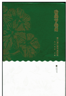
《骑鹤下扬州——第六届江苏书展回望》 江苏凤凰文艺出版社 现代快报主编

当我们今天看这些经典诗文书时，万不可孤零零地看一个字、两个字，或孤零零地看一首诗、一段文章。每一个字其实都在诉说，每一句话都在诉说，每一个人也在诉说，历朝历代的人都在诉说，无法言尽。正是因为你无法言尽，正是因为你听到的声音、我听到的声音，所以阅读是个人的事情。你透过那些文字，能看得出历史就离我们不远。