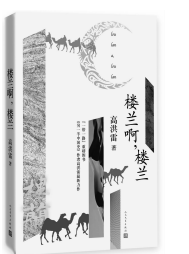
2018年1月 人民文学出版社 高洪雷 《楼兰啊,楼兰》

传之佚文,均略据所叙人事,分条罗列,并于其下注明出处,书名、卷数俱列全称。如征引之题名同异,亦一一列举,不厌其烦。凡一事而见诸多处征引者,则以某引为本,校以他引,择善而从,或同或异,或补或删或改,均出校语,条列其下。差异较大者及其他需特别说明者,则加案语,附各条之后。辑录所据之本,均以历代精校、精刻、精印之善本为主,并参校其他传本。古籍旧注尤重汉魏六朝及近于汉魏六朝之书,类书则多以南北朝唐宋所出为主,明清类书亦采,资证而已。如某传有前代辑本,亦取作参考,体例科学。