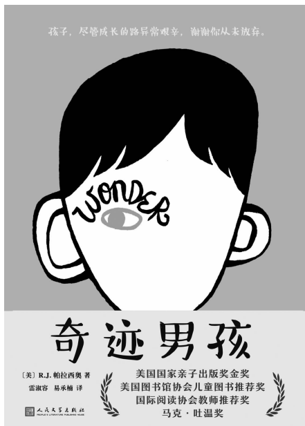
《奇迹男孩》 [美]R.J.帕拉西奥 著 人民文学出版社2018年1月