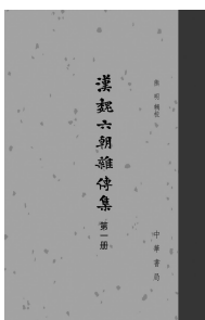
2017年6月 中华书局 熊明 《汉魏六朝杂传集》

《汉魏六朝杂传集》(全四册),辑录了起西汉之始(公元前206年)迄隋亡(公元618年)的整个汉魏六朝时期的杂传作品,共分为两汉杂传、三国杂传、两晋杂传、南北朝杂传,凡三百余种,洋洋一百余万言,整个汉魏六朝时期有佚文存世的杂传作品,几乎囊括无遗。同时,《汉魏六朝杂传集》辑录杂传,篇名之下均置题注,扼述该传之历代著录、补录情况。如有旧辑本,亦说明其见载之处及得失善劣。又略及作者之生平著述,传主之生平行事。其有歧疑者,则参纳古今学者之研究,稍事考辨。所辑得的每一种杂