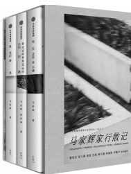
2018年1月 中信出版集团 马家辉 张家瑜 《马家辉家行散记》

从一个锐气十足的少年,到一位温暖老公,再至温柔老爸;马家辉如何一步一步走成另外一个马家辉?又是什么触动着一个怕黑怕人怕饿怕晕机的“恐游症患者”走过一处又一处,留下一段又一段浪漫感性的马氏游记?