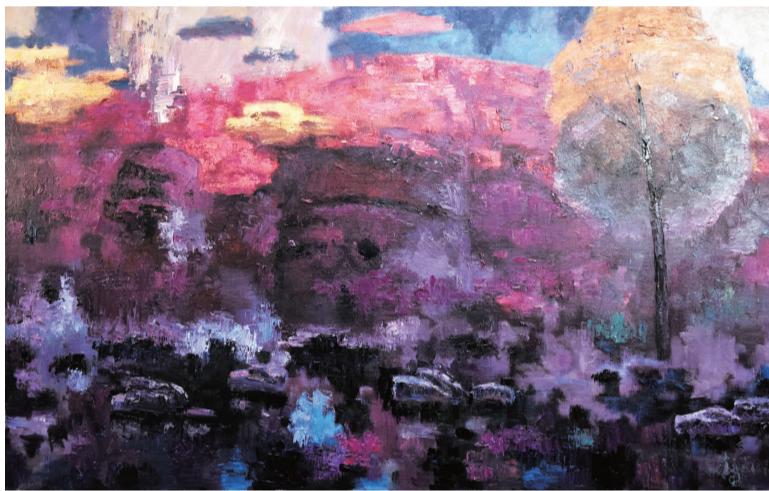
徐开利《曙色石头城》