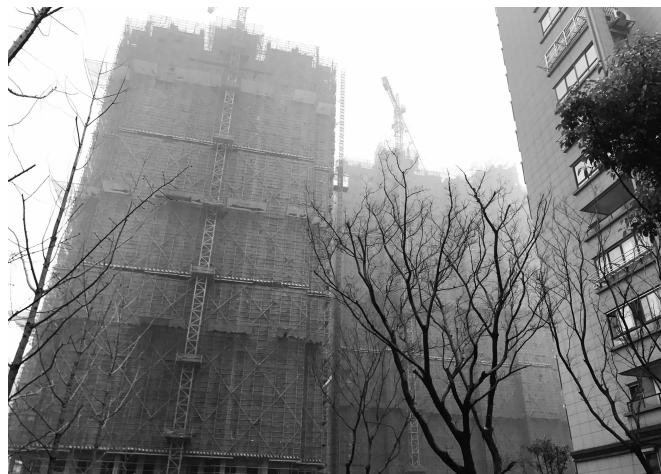
康利华府在建已经封顶的楼房