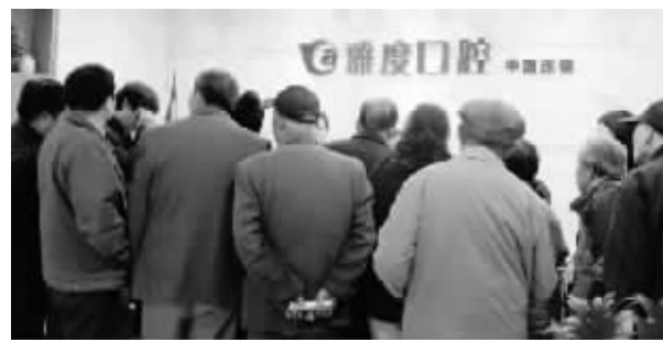
德系雅度口腔种植牙品质备受信赖