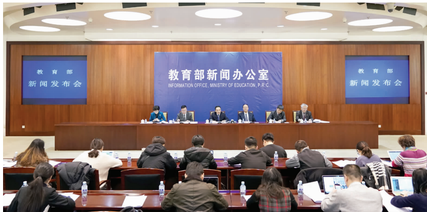
1月16日,教育部举行新闻发布会,请相关负责人介绍《普通高中课程方案和语文等学科课程标准(2017年版)》的有关情况