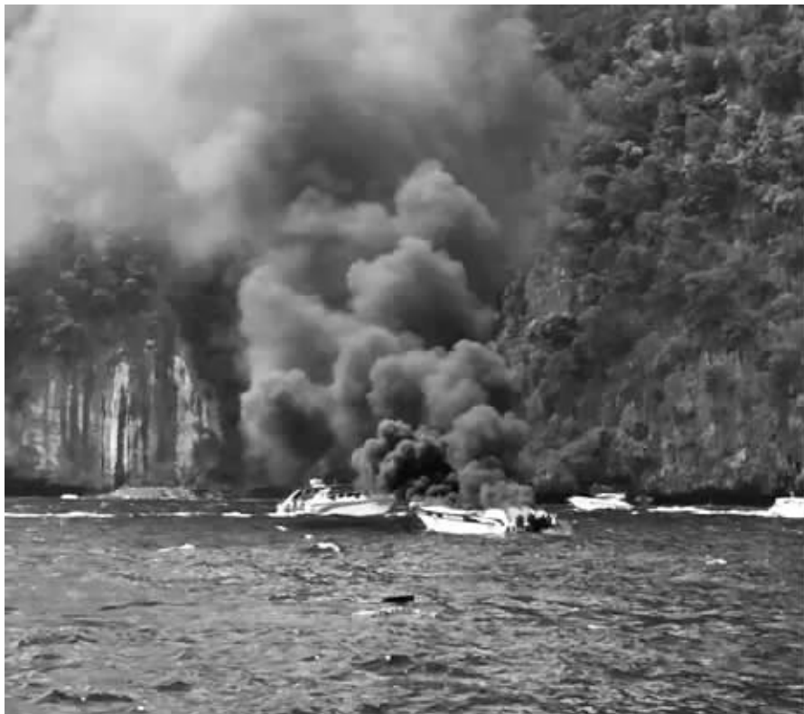
快艇起火后冒浓烟