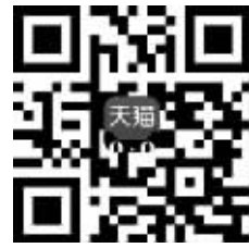
扫描二维码即可购书

如何让孩子免遭性侵害?孩子遭遇性侵害后,父母怎么应对?0—18岁孩子的父母必读。