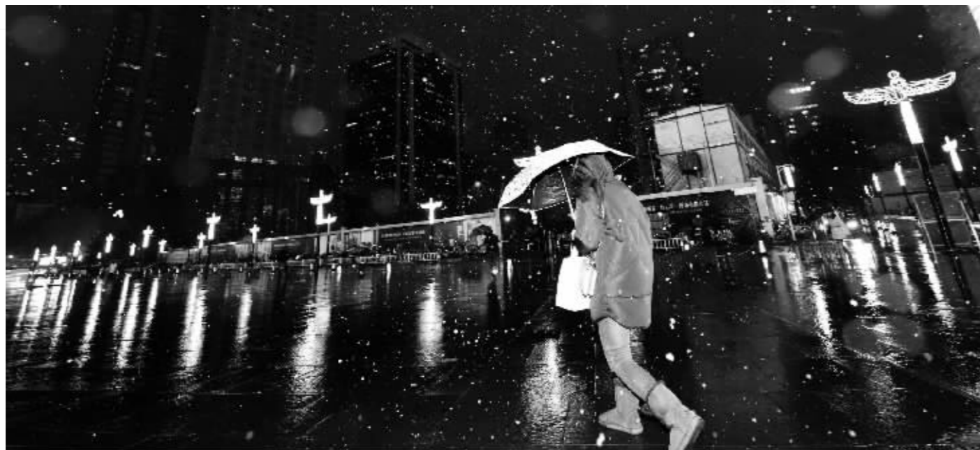
昨天晚上,南京下雪啦