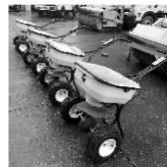
手推式撒布机