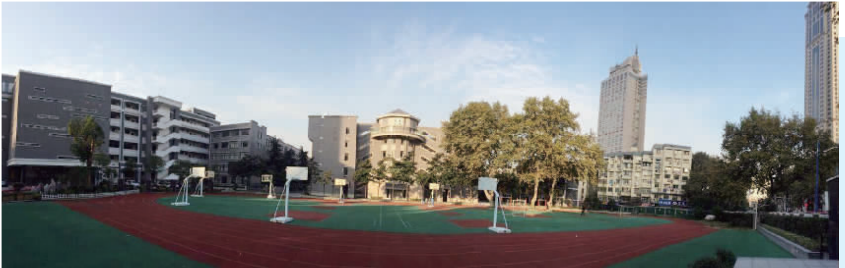
南大附中校园美景

“你家孩子课外英语学什么?”对不少家庭来说,英语是孩子的必修课。除了校内学习,越来越多的家长还选择送孩子上各类辅导班。新概念、新课标之外,如今,南京又多了英语课外学习新选项——剑桥英语。12月9日,南京大学附属中学剑桥英语证书考点迎来了数百名考生。其中,年龄最小的考生才上小学四年级。