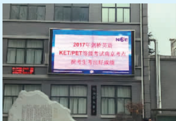
南大附中是剑桥英语考试考点