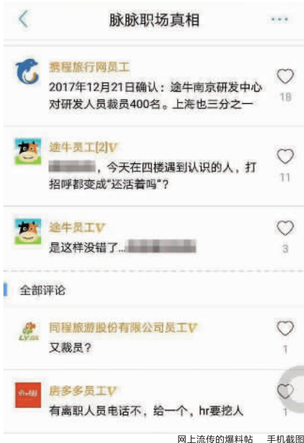
网上流传的爆料帖 手机截图

业内人士分析,此次途牛遭遇裁员风波,或与高管层变动带来的业务调整有关。不过,知乎上也有网友认为,企业“瘦身”是很常见的事情,便于未来轻装上阵。