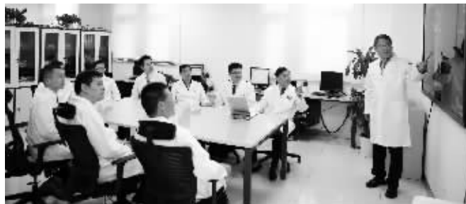
国家临床重点专科口腔颌面外科组织疑难复杂病例讨论