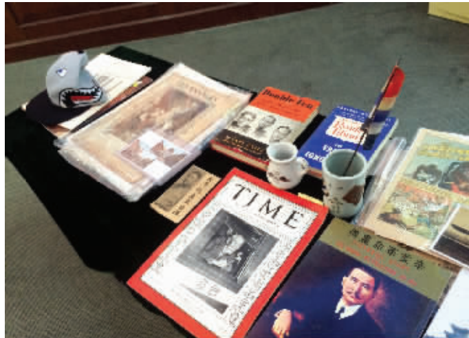
陈灿培博士这次捐赠的很多文物记录了孙中山先生的早期革命史

此外,一面一百多年前的小旗子也是这批文物中的一大亮点。别小看这面只有手掌大小,红