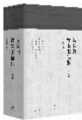
2017年11月 世纪文景上海人民出版社 梁培宽编注 《梁漱溟往来书信集》

梁漱溟是20世纪中国独具风骨的思想家、社会实践者,在他近百年的人生中,与众多学者、师长、名流、友人通过信件进行交往。梁先生逝世后,他的长子梁培宽先生逐步将信件收集归纳并加以整理。《梁漱溟往来书信集》辑录了梁漱溟先生七十年来往来的书信700余封,是迄今最为全面的一次梁漱溟