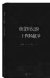
2017年10月 中华书局 黄朴民 白立超 熊剑平著 《改变历史的二十四场战争》