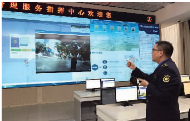
工作人员可以通过视频连线,实时查看网格员和巡查员的巡查情况